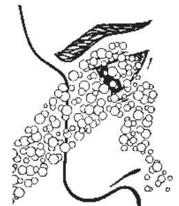
Exclusive Aerated Eyewashes

ชุดล้างตาสำหรับติดตั้งบนเคาน์เตอร์ หัวจ่ายฟองอากาศ สามารถจ่ายได้ 90 องศา